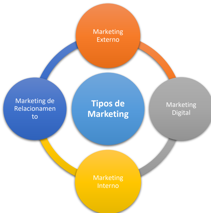
Figura 2- Tipos de marketing

Machado et al., (2015); Chaves (2018), defendem a ideia de que na odontologia esse mesmo marketing não pode ser utilizado de forma diferente, pois ele serve para elevar a amplitude do mercado consumidor e satisfazer os resultados esperados pelo cliente. Partindo desse pressuposto, deve-se pensar na qualidade do atendimento às pessoas. Por isso, é de grande valia salientar que o cirurgião dentista administre seu consultório não só como uma empresa que presta serviços à sociedade, mas também como uma empresa que oferta serviços pensando no bem estar e qualidade de vida dos seus clientes. E dessa forma, evitando transtornos, bem como, a perda de clientes já existentes e a decadência pela falta de novos clientes, o que acarreta na crise de rentabilidade do consultório.